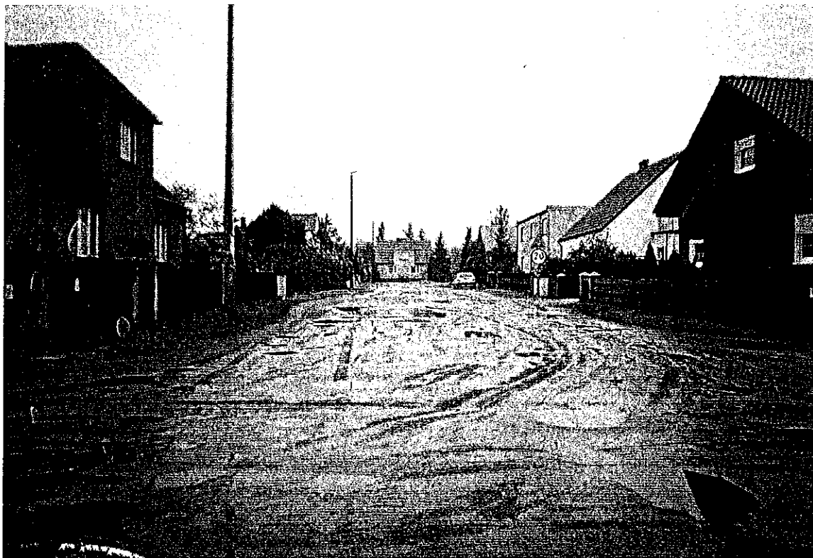
fragment ul.Slósarskiego (tak , tak na pierwszym planie to asfalt) i ul.Kanałowej