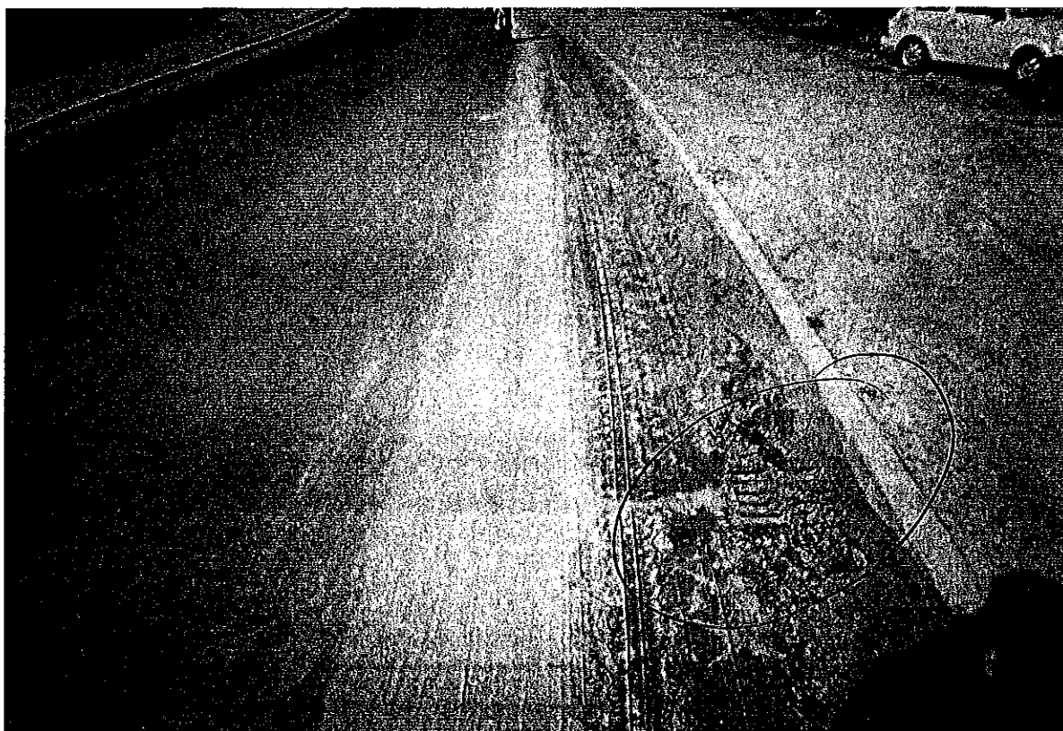
ul.Ślósarskiego - piasek - kanat (2)