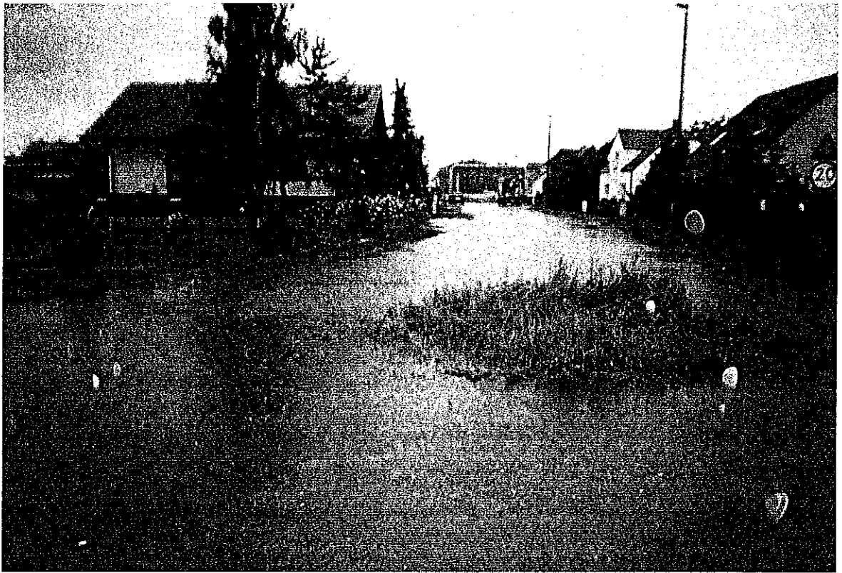
ul. Kanałowa widok od ul. Piaskowej