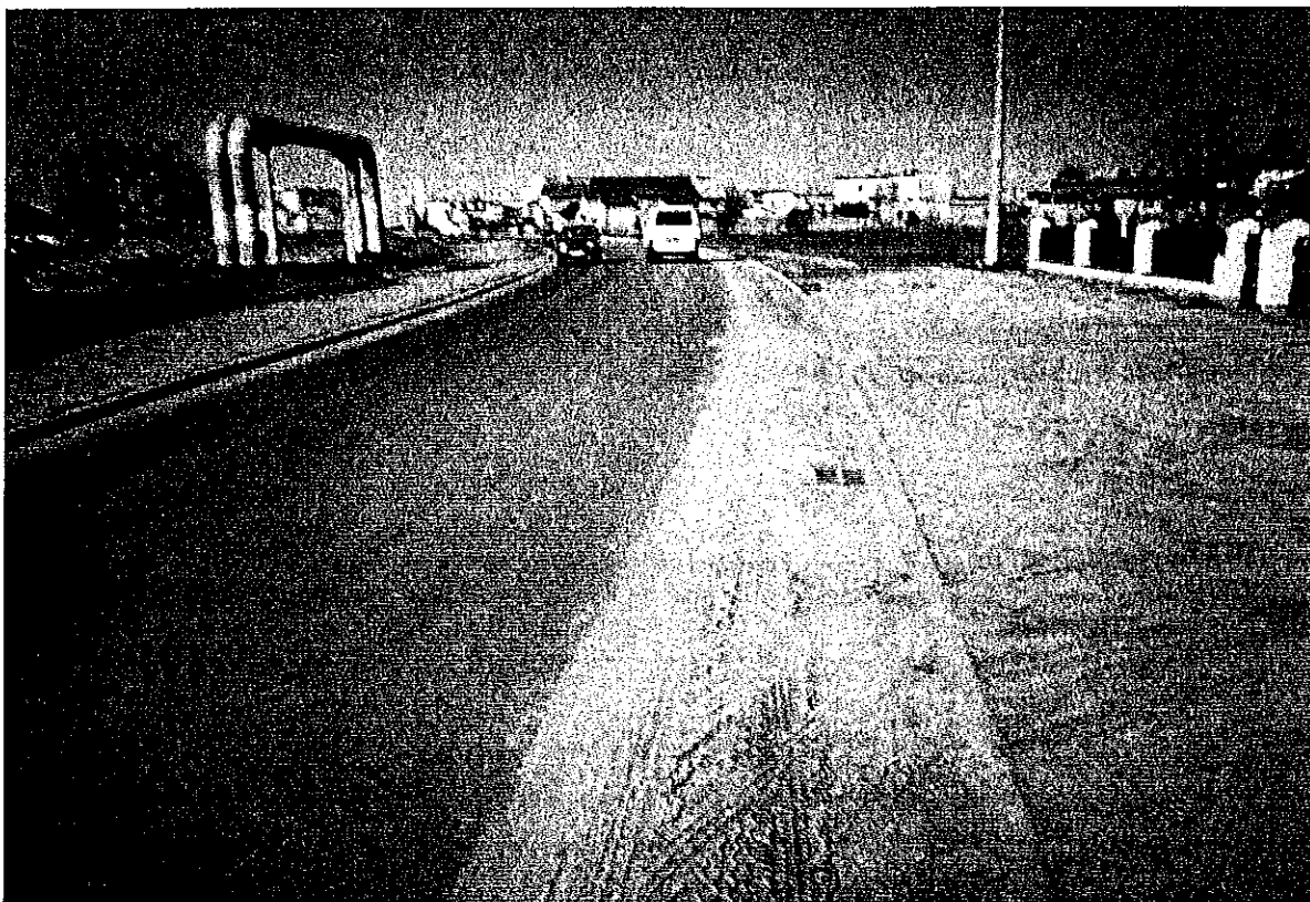
ul.Ślósarskiego - piasek (1)