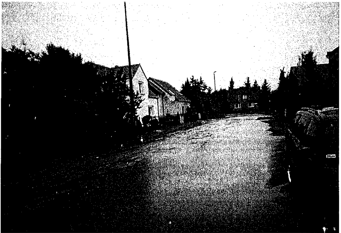
ul. Kanałowa widok od ul. Ślósarskiego